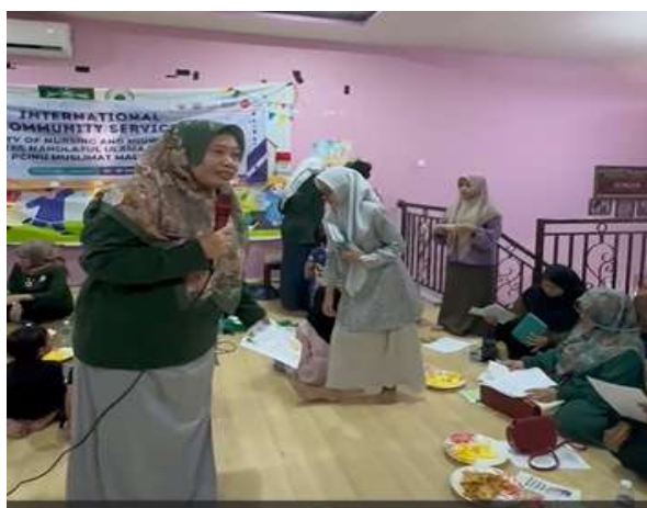
Gambar 4. Penjelasan Materi

Bedasarkan gambar 5 melakukan penyuluhan materi tentang pelecehan seksual dan peserta sangat antusia dalam mendengarkan