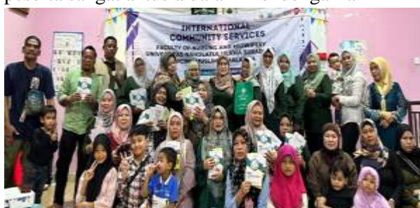
Gambar 5. Bersama seluruh peartisipan TKI dan TKW di PCI Muslimat NU Malaysia

Bedasarkan gambar 5 melakukan penyuluhan materi tentang pelecehan seksual dan peserta sangat antusia dalam mendengarkan