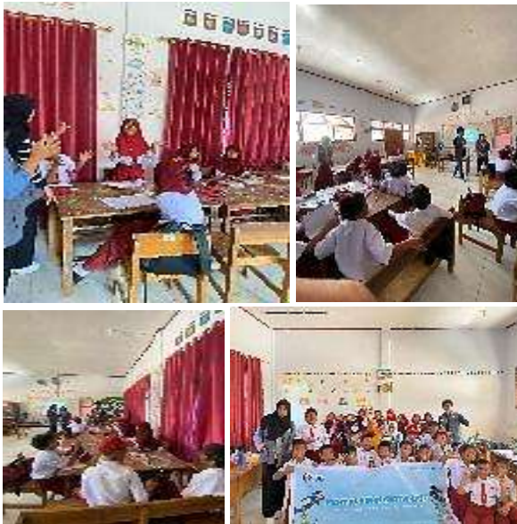
Gambar 2. Dokumentasi pelaksanaan PkM

Adapun dokumentasi pelaksanaan pengabdian kepada masyarakat ini dapat disajikan sebagai berikut: